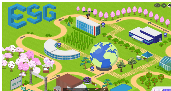
<ZEP+Spatial 공동 개최(내가 그린 우리 지구)>