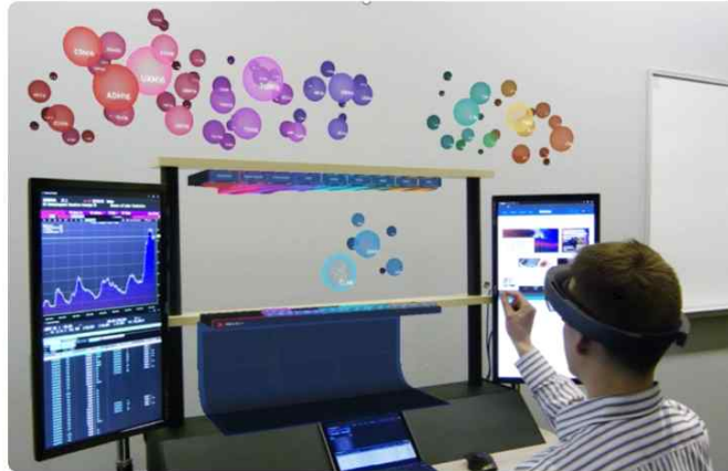
시티은행의 홀로렌즈를 사용한 데이터 분석 업무