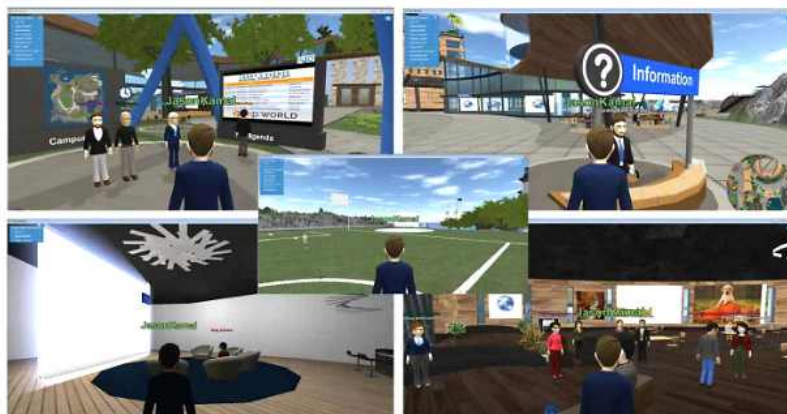
[그림] eXp Reality 직원들이 일하는 eXp World

eXp리얼리티 직원들은 PC에 eXp월드를 설치한 후 메타버스 사무실에서 아바타로 모여서 회의하고 함께 캠퍼스를 걸거나 자유공간에서 휴식할 수 있다. 업무에 관한 궁금증은 근처에 있는 직원들에게 언제든지 물어볼 수 있다. 심지어 외부 파트너와 고객을 eXp월드에 초대하는 것도 가능하다.